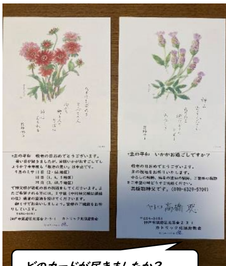
どのカードが届きましたか?

現在は、訪問活動、送迎活動、「敬老の集い」はストップ。遠足は感染者が少ない時期に不定期で行っています。カードの送付はクリスマスだけではなく、敬老のお祝い、ご復活、死者の月など逆に増やしています。